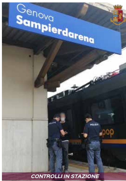
CONTROLLI IN STAZIONE

Polizia Giudiziaria del Compartimento Polfer della Liguria, al termine di una attività investigativa coordinata dalla locale Procura della Repubblica, ha eseguito 3 custodie cautelari in carcere nei riguardi di 3 cittadini stranieri dediti alla commissione di una serie di furti nei confronti di viaggiatori a bordo treno e nelle stazioni liguri. Attraverso un modus operandi ben collaudato, i tre uo-