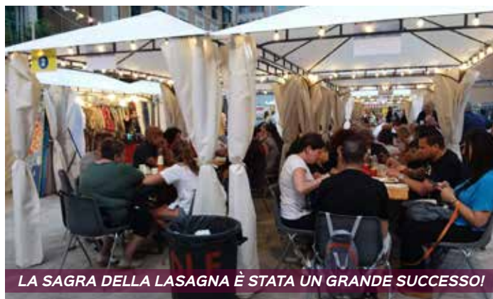
LA SAGRA DELLA LASAGNA È STATA UN GRANDE SUCCESSO!

E arriviamo alla seconda edizione dei "Mercatini di Natale" che, dato il grande successo dello scorso anno, sono previsti per quattro giorni, dall'8 all'11 dicembre. I programmi di tutte le manifestazioni sono disponibili sui canali social del DLF e del Cinema Albatros!