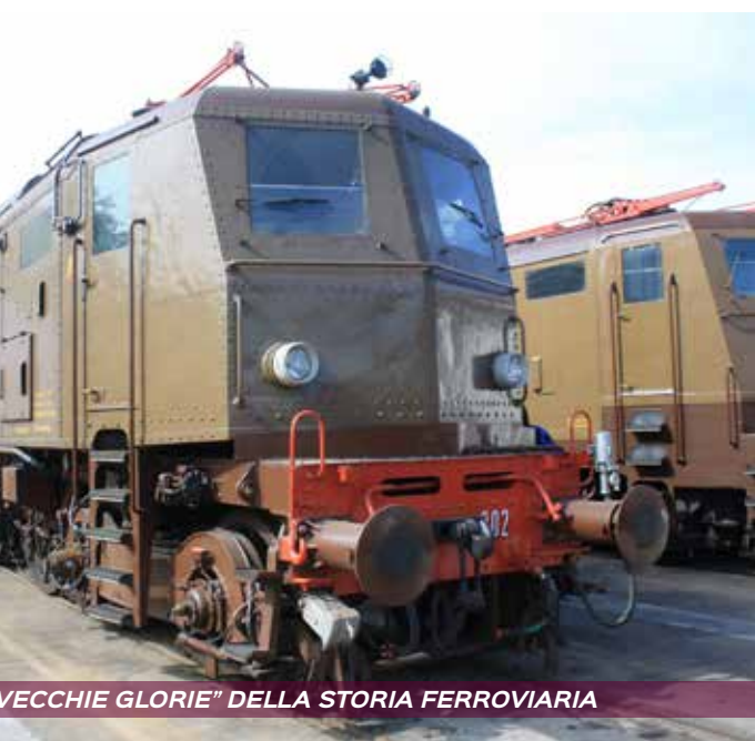
“VECCHIE GLORIE” DELLA STORIA FERROVIARIA