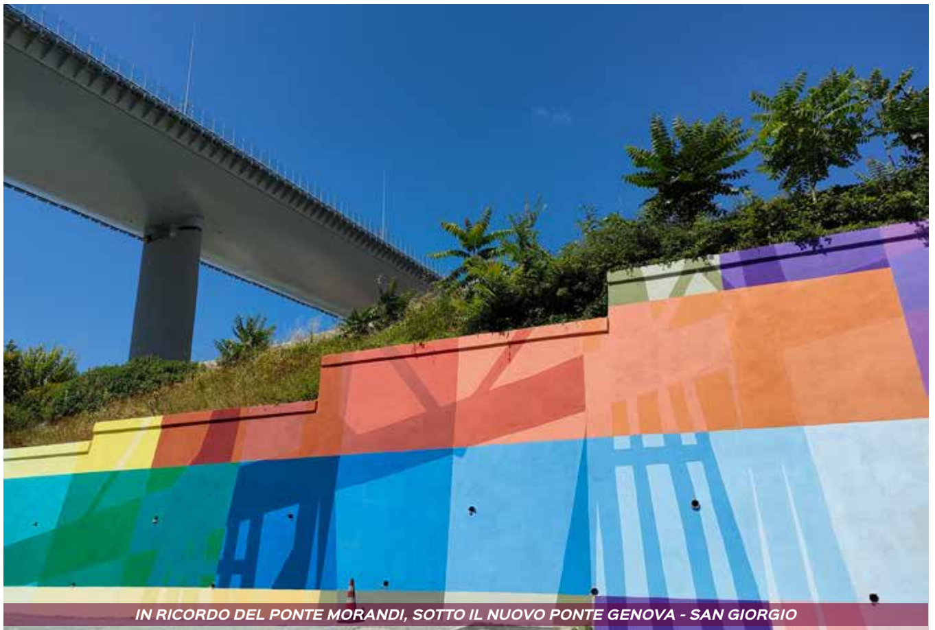
IN RICORDO DEL PONTE MORANDI, SOTTO IL NUOVO PONTE GENOVA - SAN GIORGIO

Solo così potremo ritornare nella Radura della Memoria e ricordare con più serenità il tempo vissuto nella nostra via Porro.