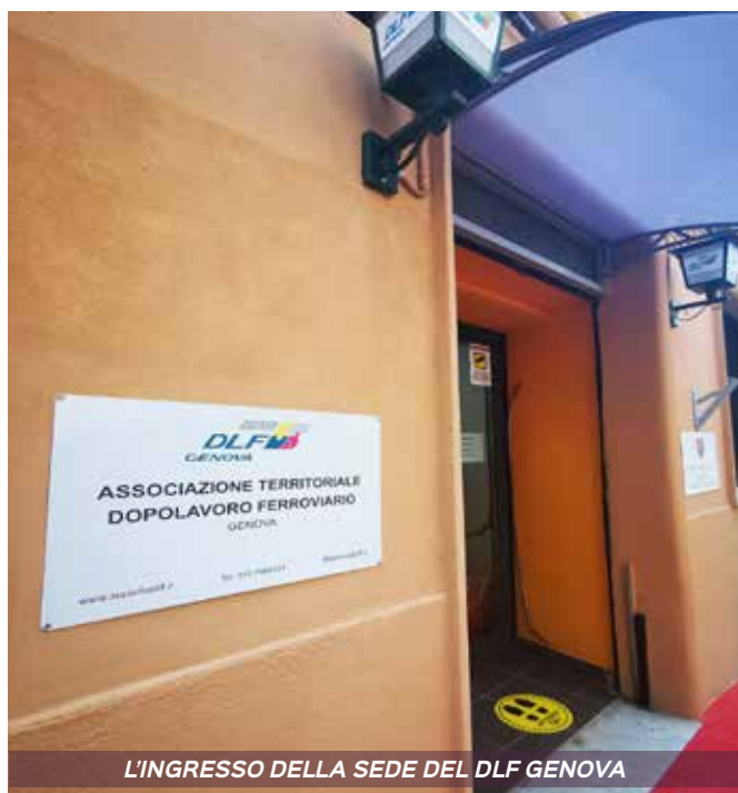
L'INGRESSO DELLA SEDE DEL DLF GENOVA

Insomma, siamo tutti pronti ad affrontare con serenità il nuovo 2022.