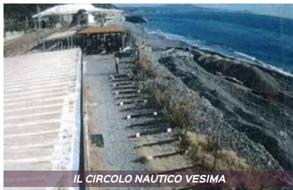
IL CIRCOLO NAUTICO VESIMA

I ferrovieri in servizio e in pensione che desiderano utilizzare una cabina presso il Circolo Nautico Vesima possono inviare la richiesta all'indirizzo mail: