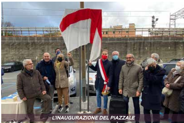
L'INAUGURAZIONE DEL PIAZZALE