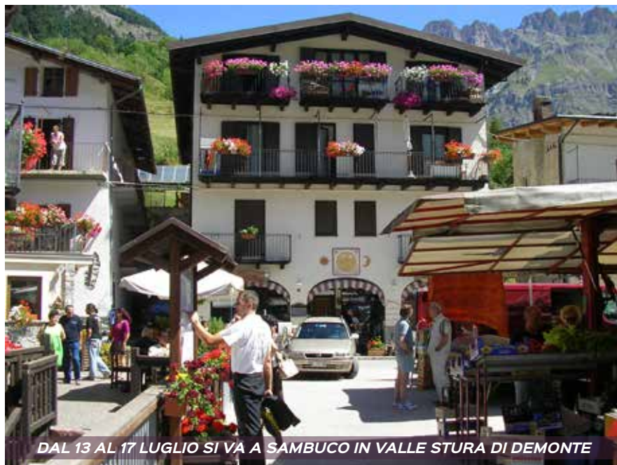
DAL 13 AL 17 LUGLIO SI VA A SAMBUCO IN VALLE STURA DI DEMONTE

Dolomiti inconsuete, poco conosciute quelle tra Comelico e Carnia: il lato B delle montagne di Cortina, altrettanto affascinante, seppure visto da località silenziose in cui il lavoro antico sui campi e sugli alpeggi si affianca a un turismo ancora da inventare. Qui accompagnati dalla guida Stefano