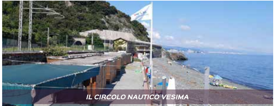
IL CIRCOLO NAUTICO VESIMA

Cosa fare nelle giornate estive più calde, quelle in cui l'afa non molla la presa e tutte le spiagge sono prese d'assalto? I soci del DLF non devono preoccuparsi: a pochi chilometri della città, ma già in riviera, c'è il nostro Circolo Nautico di Vesima, che ogni anno si fa più bello per accogliervi in tutta sicurezza e tranquillità. Rispetto normative Covid garantito, ambienti spaziosi e poco affollati, cabine, giochi per bambini, spazio per organizzare i propri pranzi e le grigliate in compagnia, e per i tornei di petanque e... tanto altro in questo nostro bellissimo gioiellino! Che altro dire? Vi aspettiamo a Vesima, ricordandovi che prenotare una cabina da noi vi dà diritto a usarla per tutto l'anno a un prezzo imbattibile! Buona estate a tutti!