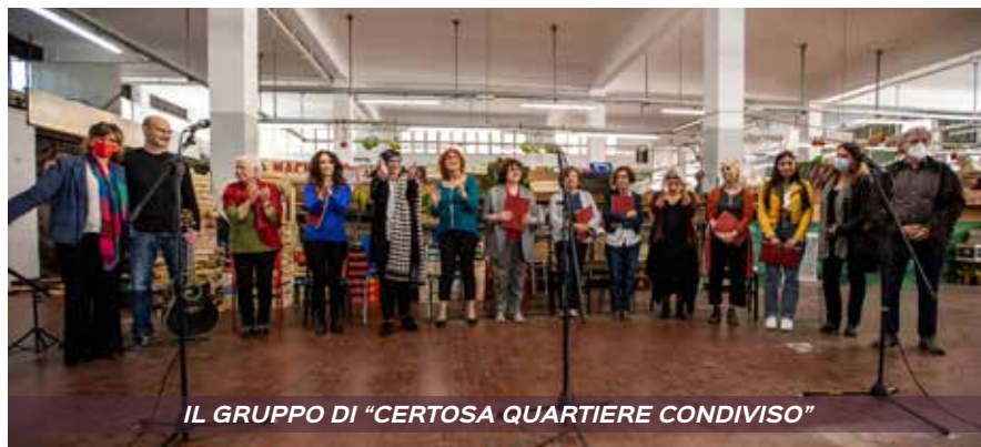
IL GRUPPO DI "CERTOSA QUARTIERE CONDIVISO"

...Certosa in lontananza, malinconia, mancanza. Certosa chiaroscurato, passato, presente e futuro!