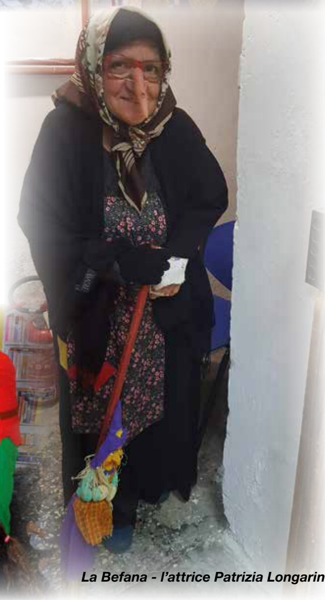
La Befana - l'attrice Patrizia Longarini