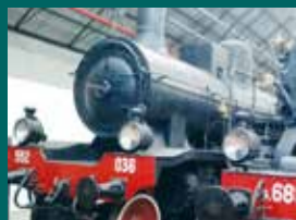
PROGETTO SCUOLA FERROVIA