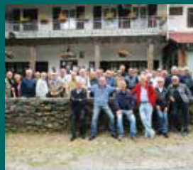
PRANZO SOCIALE VIAGGIANTE