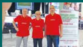
IL TOUR DELLA SALUTE