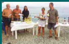
GARE CENTRO NAUTICO