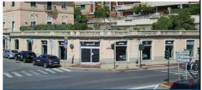
Corso Italia 30r - 16145