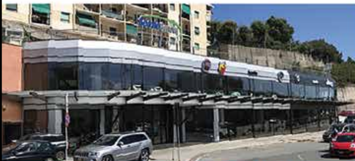
Nuova Apertura - Via Siffredi 49r - 16153