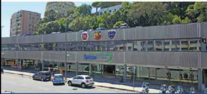
Nuova Apertura - Viale Brigate Partigiane 3c/r 16129

APERTI ANCHE DOMENICA dalle 10:00 - 12:30 e dalle 15:00 - 19:00