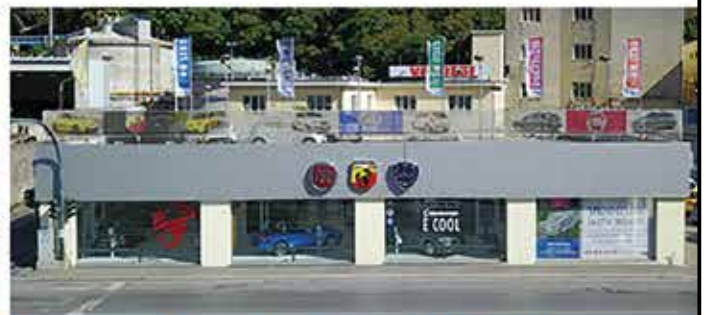
Lungobisagno Istria 44f/r - 16141