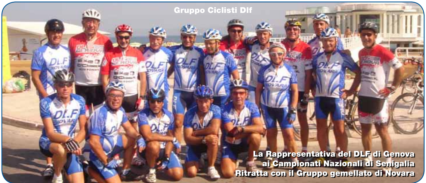
Gruppo Ciclisti Dlf

La Rappresentativa del DLF di Genova ai Campionati Nazionali di Senigallia Ritratta con il Gruppo gemellato di Novara