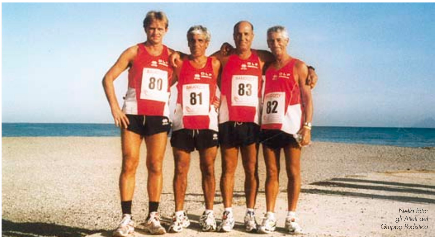
Nella foto: gli Atleti del Gruppo Podistico

Al sabato si è svolta la mezza maratona di Km 21,097 con 121 iscritti, compresi i nostri 4 podisti, percorrendo il lungomare di Brolo per cinque volte co arrivo allo stesso punto di partenza; mentre domenica mattina, 30 settembre, si è svolta la manifestazione, bellissima nella coreografia per i vari colori, della cicloturismo: percorso di circa Km 71 con partenza e arrivo a Capo Calavà nei pressi del nostro villaggio, la comitiva dei ciclisti, 426 iscritti, ha attraversato le bellissime località della Costa Saracena: Brolo – San Gregorio – lungomare di Capo D'Orlando – lungomare di S. Agata – Militello e rientro a Capo Calavà.