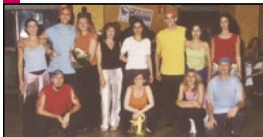
Foto di gruppo per gli allievi dei corsi di balli caraibici