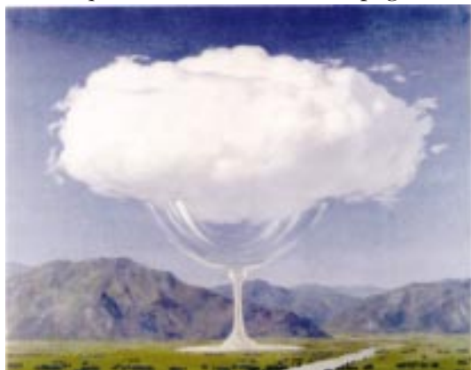
• René Magritte - LA CORDE SENSIBLE, 1960

Siamo indietro anche con i trasporti. A Milano il metrò ha cinque linee, la nostra metropolitana dovrebbe correre da Voltri a Nervi da Sampierdarena a Pontedecimo e da Brignole a Prato ma... piccon dagghe cianin! E non andiamo meglio con le linee ferroviarie e i treni. A Milano ( e dàggbela ) da quasi due anni, circolano le carrozze color verde chiaro dei treni regionali (uno ogni 5 minuti) con la scritta: -Ferrovie della Regione Lombardia- . Se le linee ferroviarie e metropolitane, tra Liguria, Piemonte e Lombardia, fossero molto più efficienti di quelle attuali, durante i periodi più freddi dell'anno (non solo d'estate) un gran numero di padani e piemontesi potrebbe lavorare in loco e tornare nelle seconde case in Liguria, a respirare una boccata d'aria priva di nebbia, diventando anche loro cittadini del sole e innescando un pendolarismo che porterebbe riflessi positivi all'economia locale e alla Liguria. Un po' come succede in Giappone, dove c'è gente che abita a cento, duecento chilometri da Tokio eppure, data l'efficienza dei trasporti, il tempo di percorrenza è ridotto al minimo e il pendolare torna comodamente a casa o in una qualsiasi residenza di campagna.