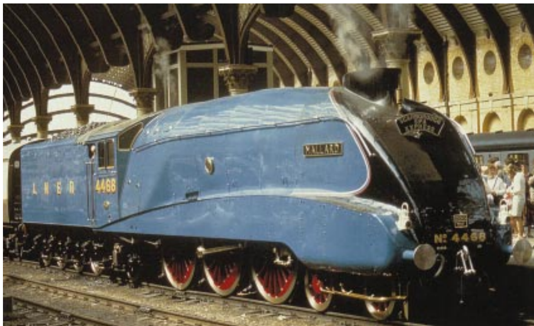
• Locomotiva a vapore "Mallard", delle linee inglesi, che il 4 luglio 1938 raggiunse i 202 km/h, record mai eguagliato.

Questa fase di cambiamento che il giornale sta attraversando ci sembra anche il momento adatto per invitare i nostri iscritti a farci sentire il loro parere e le loro considerazioni; mettetevi in contatto con noi, cari Soci, nel modo che vi sembrerà più opportuno; il giornale vive ed esiste per essere al servizio dei Soci e sono le vostre sollecitazioni che lo hanno fatto come è attualmente e come sarà in futuro.