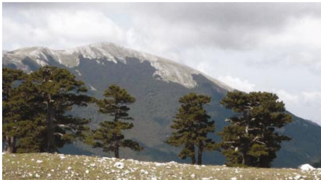
● il monte Pollino