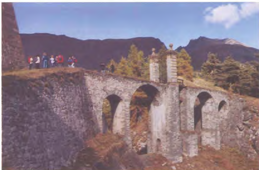
• In questa pagina e nella precedente, due vedute del Forte.

Ci torneremo nei prossimi anni, perché ne vale proprio la pena.