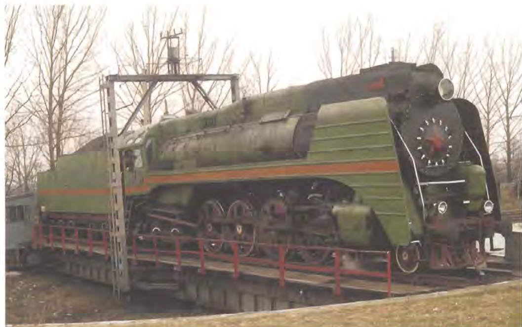
• Nella foto la locomotiva russa 242 "P36", in servizio nelle steppe fino agli anni Ottanta.

Il Dopolavoro Ferroviario vuole essere protagonista di questo grande evento attraverso le proprie strutture e le iniziative dei Gruppi di attività. Per questa ragione ci siamo subito attivati, partecipando ai tavoli tematici, incontri cittadini che si sono svolti, prima dell'estate, a Palazzo Ducale. La seconda e più impegnativa fase ci deve vedere attivi con proposte operative, che mettano in luce il valore e i contenuti della nostra attività sociale, contenuti che si possono trasferire a vantaggio dell'intera città. L'invito che facciamo ai Gruppi del nostro Dopolavoro (e anche ai singoli Soci) è quello di lavorare insieme per contribuire al successo di un evento che vede protagonista Genova, portando avanti le idee e le iniziative che caratterizzano la nostra Associazione.