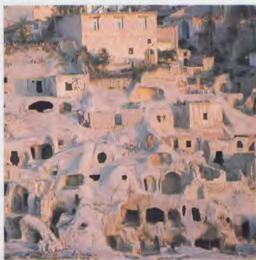
Paesaggi della Cappadocia